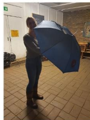
Nu hebben we de paraplu's niet meer nodig